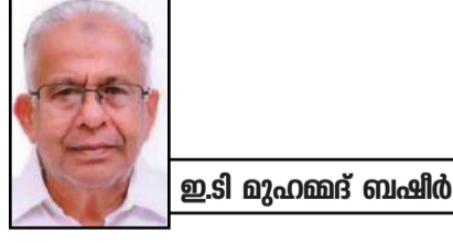
ഇടി മുഹമ്മദ് ബഷീർ