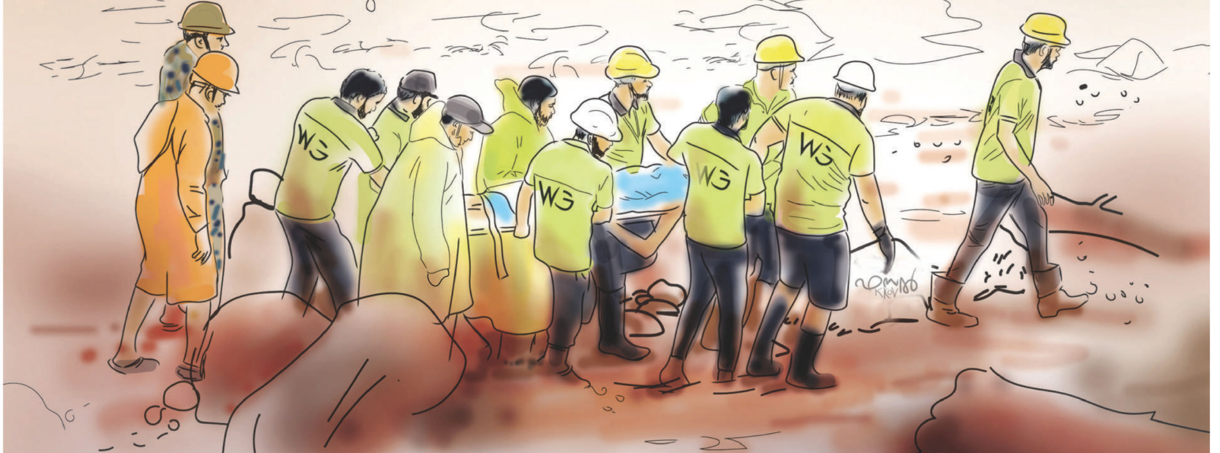
വര: ഫസൽ കക്കോവ്