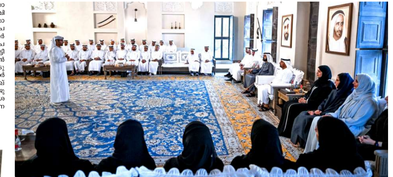
യുഎഇ വൈസ് പ്രസിഡന്റും പ്രധാനമന്ത്രിയും ദുബൈ ഭരണാധികാരിയുമായ ശൈഖ് മുഹമ്മദ് ബിൻ റാഷിദ് അൽ മക്തൂം ദുബൈ അൽ ഷിന്ദഗയിലെ തന്റെ പ്രതിവാദ മേഖലയിൽ പ്രാദേശിക പ്രമുഖർ, വ്യവസായ പ്രമുഖർ, നിക്ഷേപകർ, മുതിർന്ന ഉദ്യോഗസ്ഥർ എന്നിവരുമായി കൂടിക്കാഴ്ച നടത്തുന്നു.

മുൻപാണു, ആഗോള മാറ്റത്തിന് അനുസൃതമായി നവീകരണവും നൂതന സാങ്കേതികവിദ്യയും ദുബൈയുടെ സമ്പന്നവും ശോഭനവുമായ ഭവനങ്ങളുടെ പ്രധാന ഘടകങ്ങളാണ്. ബിസിനസ്സു ശക്തമാക്കുന്നതിനും നടപടിക്രമങ്ങൾ ഉള്ളിലാക്കുന്നതിനും നവീകരണത്തിന്റെ ആഗോള കേന്ദ്രമെന്ന നിലയിൽ ദുബൈയുടെ സ്ഥാനം ശക്തിപ്പെടുത്താനും നൂതന സാങ്കേതികവിദ്യകളുടെ സ്റ്റാൻഡ്ഡുകൾക്ക് അനുയോജ്യമായ അന്തരീക്ഷം നൽകാൻ ഞങ്ങൾ പ്രതിജ്ഞാബദ്ധരാണ്.