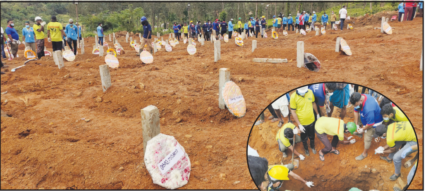
വയനാട് ഉൾപ്പെട്ടവർക്ക് മരിച്ച തിരിച്ചറിയാൻ കഴിയാത്ത മുതലേ ഹങ്ങൾ വെറ്റ് ഗാർഡിന്റെ നേതൃത്വത്തിൽ സംസ്കരിക്കുന്നു.