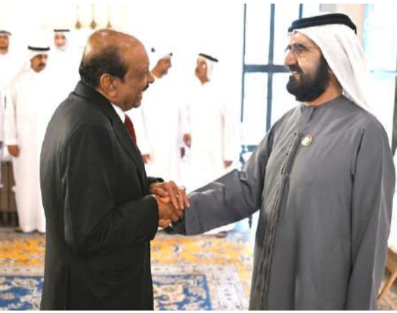
ശൈഖ് മുഹമ്മദ് ബിൻ റാഷിദ് അൽ മക്തൂമിന്റെ പ്രതിവാദ മേഖലയിൽ പങ്കെടുക്കാൻ എംഎ യുസഫലി എത്തിയപ്പോൾ

ദുബൈ: യുഎഇ വൈസ് പ്രസിഡന്റും പ്രധാനമന്ത്രിയും ദുബൈ ഭരണാധികാരിയുമായ ശൈഖ് മുഹമ്മദ് ബിൻ റാഷിദ് അൽ മക്തൂം ദുബൈയിലെ അൽ ഷിന്ദഗയിലെ തന്റെ പ്രതിവാദ മേഖലയിൽ പ്രാദേശിക പ്രമുഖർ, വ്യവസായ പ്രമുഖർ, നിക്ഷേപകർ, മുതിർന്ന ഉദ്യോഗസ്ഥർ എന്നിവരുമായി നടത്തിയ കൂടിക്കാഴ്ചയിൽ ലുലു ഗ്രൂപ്പ് ചെയർമാൻ എംഎ യുസഫലിയും പങ്കെടുത്തു. മെക്സിക്കോയിൽ ശൈഖ് മുഹമ്മദ് എല്ലാവരെയും സന്ദർശിച്ചു. യുസഫലിയും മറ്റു പ്രമുഖരും അദ്ദേഹത്തെ അഭിവാദ്യം ചെയ്തു.