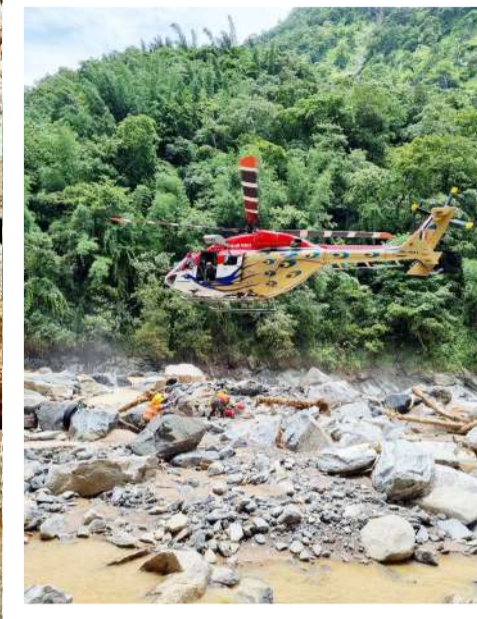
ദുരന്തത്തിൽ കാണാതായവർക്കായി സൂചിപ്പാനായി സൈന്യം തിരുച്ചിപ്പിൻ നടത്തുന്നു.

രക്ഷാപ്രവർത്തനത്തിൽ കൈകേൾക്കാൻ നിരവധി സന്നദ്ധപ്രവർത്തകരും സംഘടനകളുമാണ് മുന്നോട്ടുവന്നത്. ജില്ലാ ഭരണസംവിധാനം ഒരുക്കിയ സംവിധാനത്തിലൂടെ 18,000 പേർ വോളണ്ടിയർമാരായി രജിസ്റ്റർ ചെയ്തു. ഇതിൽ 5400 പേർ വയനാട് ജില്ലയിൽ നിന്ന് തന്നെയാണ്. ആരു മേഖലകളായി തിരിഞ്ഞ് നടത്തുന്ന രക്ഷാപ്രവർത്തനത്തിൽ 750 മുതൽ 1000 വരെ വോളണ്ടിയർമാരാണ് ഒരു ദിവസം ഇറങ്ങുന്നത്. ഇന്നലെ 1126 പേർ സന്നദ്ധത കാണിച്ചു. ദുരന്ത മേഖലയിലുണ്ട് എന്നറിയാൻ 140 ടീമുകളും വോളണ്ടിയർ പ്രവർത്തനത്തിന് രജിസ്റ്റർ ചെയ്താണ് പ്രയോജനപ്പെടുത്താനും.