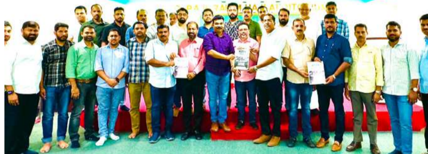
മുസ്ലിം ലീഗ് സംസ്ഥാന കമ്മിറ്റിയുടെ വയനാട് പുനരധിവാസ ഫണ്ട് വിജയിപ്പിക്കുന്നതിനായി ദുബൈ കോഴിക്കോട് ജില്ലാ കെഎംസിസിയുടെ ഓൺലൈൻ കമ്പയിന് തുടക്കം കുറിച്ചപ്പോൾ