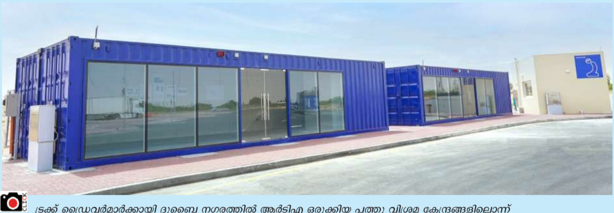
ഭൂമി വിലയിൽ 10 വിശദ കേന്ദ്രങ്ങളിലൊന്ന്

ദുബൈ: ദീർഘദൂരം നിർമ്മാണ യന്ത്രപദ്ധതികൾക്ക് ഭൂമി വിലയിൽ 10 വിശദ കേന്ദ്രങ്ങളൊരുക്കി ആർടിഎ.