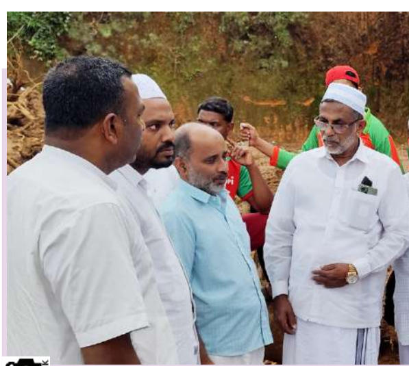
ആർ.എ.ടി.എഫ് നേതാക്കൾ വയനാട്ടിലെ മുണ്ടക്കൈ മേഖലയിലെത്തി പ്രദേശവാസികളുമായി സംസാരിക്കുന്നു