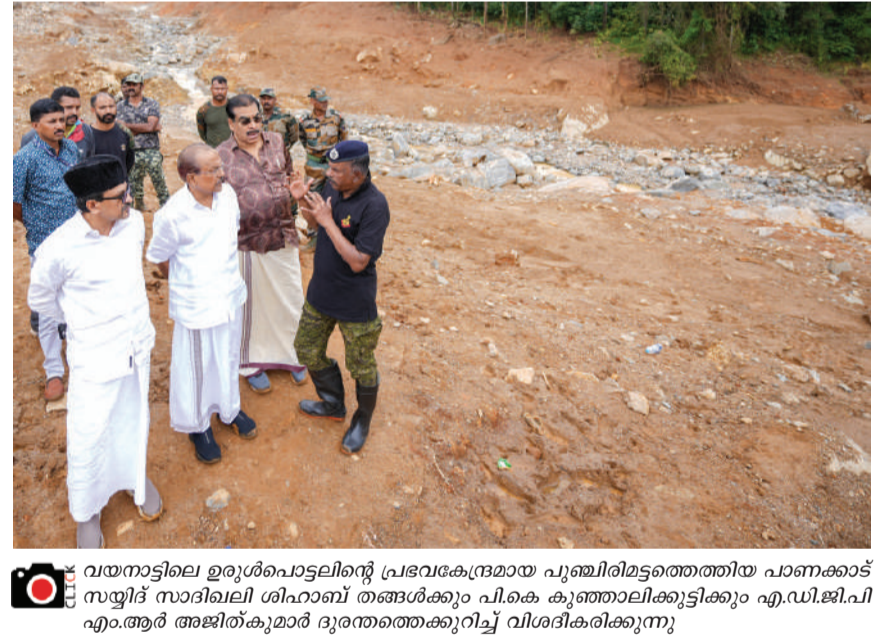
വയനാട്ടിലെ മുതലേപ്പാടുകളുടെ പ്രവേശനപാതയുടെ പുനരധിവാസ പദ്ധതിയുമായി ബന്ധിതമായി നടന്നുവരികെയാണ്. ഇതിന് മുന്നോട്ട് വയനാട് മുതലേപ്പാടുകളുടെ സംസ്കരണവും പുനരധിവാസ പദ്ധതിയുമായി ബന്ധിതമായി നടന്നുവരികെയാണ്.

കൊല്ലം മുസ്ലിം ലീഗ് മുഖേന വയനാട് മുതലേപ്പാടുകളുടെ സംസ്കരണവും പുനരധിവാസ പദ്ധതിയുമായി ബന്ധിതമായി നടന്നുവരികെയാണ്. ഇതിന് മുന്നോട്ട് വയനാട് മുതലേപ്പാടുകളുടെ സംസ്കരണവും പുനരധിവാസ പദ്ധതിയുമായി ബന്ധിതമായി നടന്നുവരികെയാണ്. കൊല്ലം മുസ്ലിം ലീഗ് മുഖേന വയനാട് മുതലേപ്പാടുകളുടെ സംസ്കരണവും പുനരധിവാസ പദ്ധതിയുമായി ബന്ധിതമായി നടന്നുവരികെയാണ്. ഇതിന് മുന്നോട്ട് വയനാട് മുതലേപ്പാടുകളുടെ സംസ്കരണവും പുനരധിവാസ പദ്ധതിയുമായി ബന്ധിതമായി നടന്നുവരികെയാണ്. കൊല്ലം മുസ്ലിം ലീഗ് മുഖേന വയനാട് മുതലേപ്പാടുകളുടെ സംസ്കരണവും പുനരധിവാസ പദ്ധതിയുമായി ബന്ധിതമായി നടന്നുവരികെയാണ്. ഇതിന് മുന്നോട്ട് വയനാട് മുതലേപ്പാടുകളുടെ സംസ്കരണവും പുനരധിവാസ പദ്ധതിയുമായി ബന്ധിതമായി നടന്നുവരികെയാണ്.