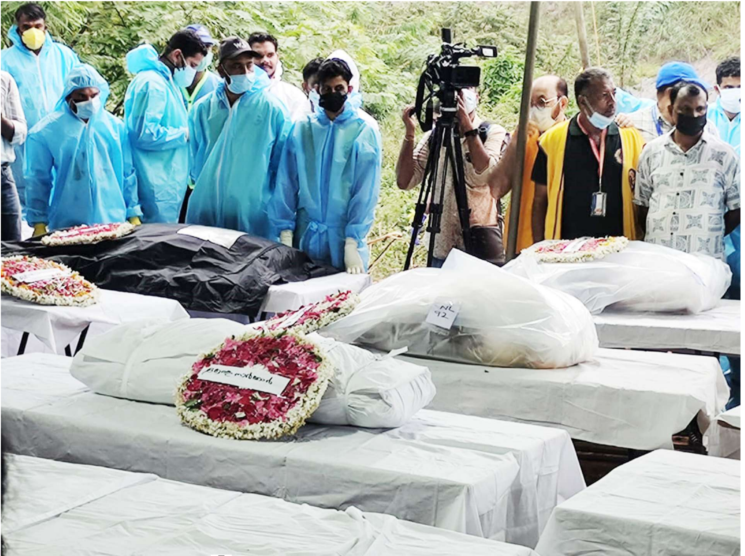
വയനാട് ചുരൽമല ഉരുൾപൊട്ടൽ മരിച്ചവരുടെ മൃതദേഹാവശിഷ്ടങ്ങൾ ഒരുമിച്ച് മറവ് ചെയ്യുന്നതിനു മുന്നോടിയായി സർവ്വത പ്രാർത്ഥനയായി പുത്തൂർമലയിലെത്തിച്ചപ്പോൾ