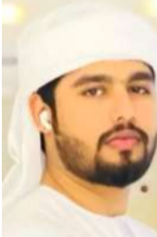
അന്വേഷണത്തിൽ അപകടത്തിൽ കണ്ണൂർ സ്വദേശി മുഖിയ്യ

അന്വേഷണത്തിൽ അപകടത്തിൽ കണ്ണൂർ സ്വദേശി മുഖിയ്യ.