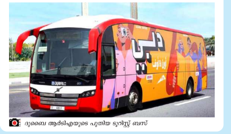
ദുബൈ ആർടിഎയുടെ പുതിയ ടൂറിസ്റ്റ് ബസ്

ദുബൈ: പൊതുഗതാഗതത്തിന് ഏറെ സൗകര്യം നൽകുന്ന ആർടിഎയുടെ പുതിയ ടൂറിസ്റ്റ് ബസ്.