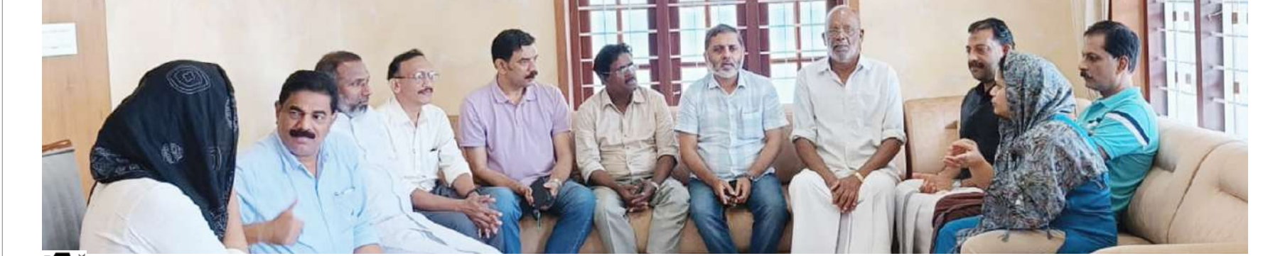
മേപ്പാടിയിൽ ദുരന്തത്തിൽ സർവ്വതും നഷ്ടപ്പെട്ട ലോയേഴ്സ് ഫോറം ജില്ലാ ക്രഷർ ബന്ധു വിട്ടിൽ ലോയേഴ്സ് ഫോറം സംസ്ഥാന ഭാരവാഹികൾ ആശ്വസിപ്പിക്കാൻ എത്തിച്ചപ്പോൾ