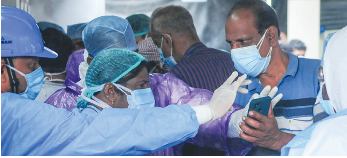
ചുരൽമലയിലെ ഉരുൾപൊട്ടലിൽ കണ്ടെത്തിയ മൃതദേഹങ്ങളിൽ തങ്ങളുടെ ബന്ധുക്കളുണ്ടോയെന്ന് അന്വേഷിക്കുന്നതിനായി മൃതദേഹങ്ങൾ എത്തിച്ച മേപ്പാടി ഹെൽത്ത് സെന്ററിലെ സന്നദ്ധപ്രവർത്തകർക്ക് മൊബൈൽ ഫോണിൽ ബന്ധുക്കളുടെ ചിത്രങ്ങൾ കാണിക്കുന്നുവർ.