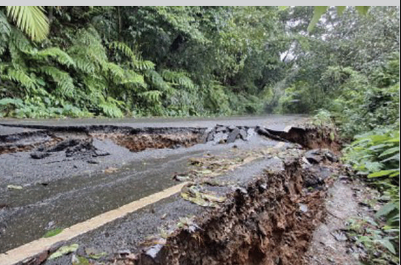
തകർന്നടഞ്ഞ പേരൂ ചുരം റോഡ്

വയനാട് ജില്ലയുമായി അതിർത്തി പങ്കിടുന്ന പേരൂ ചുരവും കണിച്ചാർ പഞ്ചായത്തിലെ സെമിനാരിവിലെ എസ്റ്റേറ്റ് ഭൂമിയും ഉൾപ്പെട്ട വിളക്കു ഇവരേ ആശങ്കയിലാഴ്ത്തുന്നുണ്ട്. കണ്ണൂർ-വയനാട് ജില്ലകളെ ബന്ധിപ്പിക്കുന്ന പ്രധാന റോഡാണ് നിട്ടംപൊയിൽ-പേരൂ ചുരം റോഡ്. ചുരത്തിലെ ഏറ്റവും മുകളിൽ വരുന്ന നാലാം വളവിലെ റോഡിൽ മുഴുവൻ വിളക്കുവിണ് ഗർത്തങ്ങൾ രൂപപ്പെട്ടിട്ടുണ്ട്. ഇതുവഴി ഗതാഗതം പൂർണ്ണമായും നിരോധിച്ചെങ്കിലും കഴിഞ്ഞ ദിവസങ്ങളിലുണ്ടായ കനത്തമഴയിൽ ആശങ്കയിലായിരുന്നു ഈ താഴ്വാറത്തെ കുടുംബങ്ങൾ. 29-ാം ഫെബ്രുവരി നാലാമത്തെ ഹെയർപിൻ വളവിൽ വരുന്ന റോഡാണ് പൊട്ടിത്തകർന്നത്. പത്ത് മീറ്ററിലധികം മണ്ണിട്ട് ഉയർത്തി നിർമ്മിച്ച റോഡിന്റെ അടിഭാഗത്ത് സോയിൽ പെപ്പിൾ പ്രതിഭാസത്തിലൂടെ മണ്ണി നിങ്ങളതാണ് വിളക്കുവിണ് കാരണമെന്ന് കരുതുന്നു. 2022ലെ ഉരുൾപൊട്ടലിൽ ചുരം റോഡിന്റെ നിരവധി ഭാഗങ്ങൾ മലവെള്ളത്തിൽ പൊട്ടിച്ചിട്ടുണ്ടിരുന്നു. ഈ ഭാഗങ്ങളിൽ