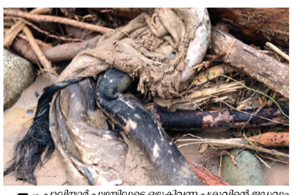
ചാലിയാർ പുഴയിലൂടെ ഒഴുകിവന്ന പശുവിന്റെ ജഡവും കൊമ്പും തരിപ്പൊട്ടി ഭാഗത്ത് അടഞ്ഞു കൂടിയപ്പോൾ