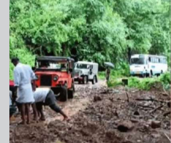
2022ൽ പേരാവൂരിൽ ഉരുൾപൊട്ടലുണ്ടായ താഴ്വാറ(ഫയൽ)