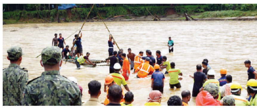
വയനാട് മുണ്ടക്കൈയിലും ചുരൽമലയിലും ഉൾപ്പെടെയിൽ മരിച്ചവരുടെ മൃതദേഹങ്ങൾ വാണിയംപുഴയിൽ ചങ്ങാത്തിലൂടെ മറുകരയിൽ എത്തിക്കുന്നു.

എടക്കര: മുണ്ടക്കൈ ഉൾപ്പെടെയിൽ ചാലിയാറിലൂടെ ഒഴുകിയെത്തിയ മൃതദേഹങ്ങൾക്കായി ചോപ്പിരിലും (ഹെലികോപ്റ്റർ) തിരച്ചിൽ. വനം, പൊലീസ്, തങ്ങൾ ബോൾട്ട് സംഘം സായുക്തമായി ഇന്ത്യൻ വ്യോമസേനയുടെ ഹെലികോപ്റ്ററിലാണ് വെള്ളച്ചാട്ടം തിരച്ചിൽ നടത്തിയത്. അരണിപ്പുഴ മുതൽ ബാലൻ തണ്ട് വരെയുള്ള ഭാഗങ്ങളിൽ തിരച്ചിൽ നടത്തിയെങ്കിലും ഒന്നും തന്നെ കണ്ടെത്താനായില്ല. രക്ഷാ പ്രവർത്തകർക്ക് നടന്നെത്താൻ കഴിയാത്ത ദുർഘട വനമേഖലയാണിത്. വയനാട് വാടേരി ഫോറസ്റ്റ് സെക്ഷനിൽ നിന്നും താഴേക്കു പരിശോധന നടത്തി വരുന്ന സംഘത്തെയും കണ്ടുമുട്ടി. സംഘത്തിൽ രണ്ടു പൊലീസ് ഇൻസ്പെക്ടർമാരും രണ്ടു ബീറ്റ് ഫോറസ്റ്റ് ഓഫീസർമാരും എട്ടു തങ്ങൾബോൾട്ട് സേനാംഗങ്ങളുമുണ്ടായിരുന്നു. വിശദമായ പരിശോധനയാണ് വയനാട് നിന്നുള്ള സംഘങ്ങൾ അതിനാൽ മുണ്ടക്കൈയിൽ നിന്നും പോയ സംഘം വൈകുന്നേരത്തോടെ മടങ്ങി. നേവയുടേതിന് പുറമെ പൊലീസ് സേനയുടെ ചോപ്പിരി വെള്ളച്ചാട്ടം തിരച്ചിലിനായി മുണ്ടക്കൈയിൽ എത്തിയിരുന്നു.