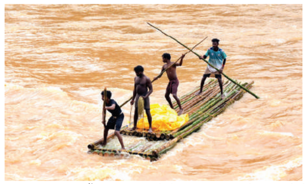
വയനാട് മുണ്ടക്കൈയിൽ ഉണ്ടായ ഉരൾപൊട്ടലിൽ ചാലിയാർ പുഴയിലൂടെ ഒഴുകിവന്ന മൃതദേഹത്തിന് വേണ്ടി വാണിയംപുഴയിൽ തിരച്ചിൽ നടത്തുന്നുവർ