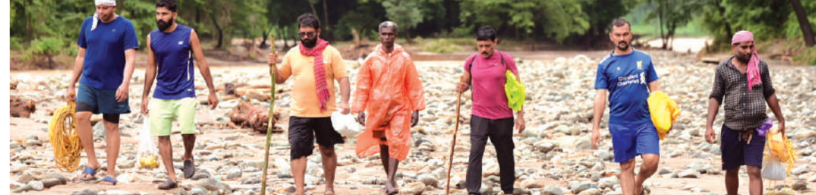
വയനാട് മുണ്ടക്കൈയിൽ ഉണ്ടായ ഉരൾപൊട്ടലിൽ ചാലിയാർ പുഴയിലൂടെ ഒഴുകിവന്ന മൃതദേഹത്തിന് വേണ്ടിയുള്ള ഇന്നലെത്ത തിരച്ചിൽ അവസാനിപ്പിച്ച് മടങ്ങുന്ന രക്ഷാപ്രവർത്തകർ