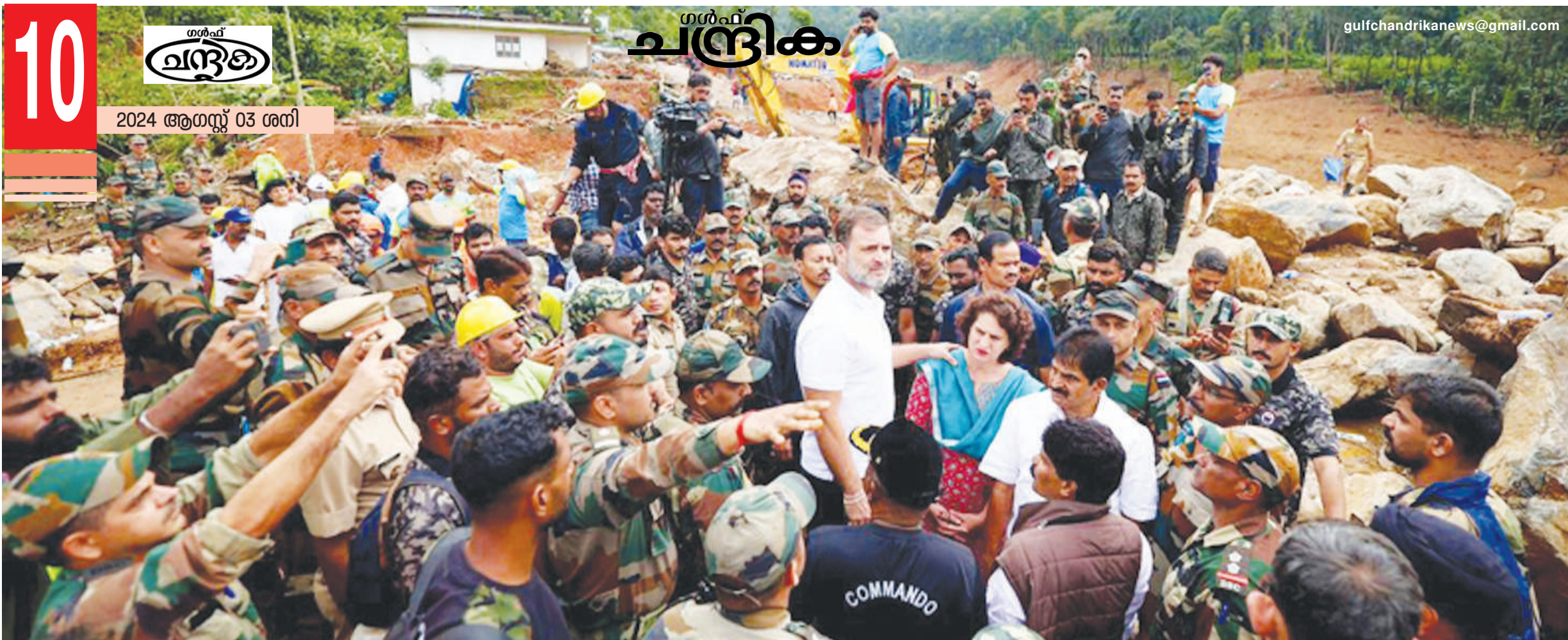
ലോകസഭ പ്രതിപക്ഷ നേതാവ് രാഹുൽ ഗാന്ധിയും എ.എ.സി.സി ജനറൽ സെക്രട്ടറി പ്രിയങ്ക ഗാന്ധിയും ഉരുൾപൊട്ടൽ ഉണ്ടായ മേപ്പാടി മുണ്ടക്കൈ പ്രദേശം സന്ദർശിക്കുന്നു.