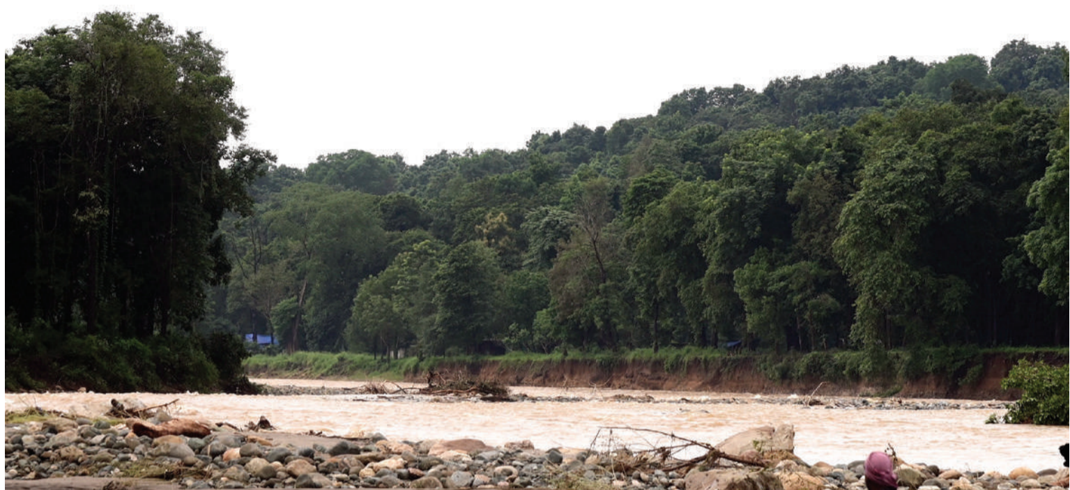
നിലമ്പൂർ മുണ്ടക്കൈ തരിപ്പൊട്ടിയിൽ ചാലിയാറിലൂടെ നാവികസേന ഹെലികോപ്റ്ററിൽ നിരീക്ഷണം നടത്തുന്നു

ചാലിയാർ പുഴ ഒഴുകുന്ന ഉൾവനത്തിലൂടെ കിലോമീറ്ററുകളോളം ദൂരത്തിലാണ് ഇന്നലെ യും തിരച്ചിൽ നടത്തിയത്. കിലോമീറ്ററുകളോളം ദൂരം കയറിയായി മൃതദേഹം ചുമലിൽ ഏറ്റിയാണ് പുഴയുടെ മറുകരയിൽ എത്തിക്കുന്നത്. വരുംദിവസങ്ങളിലും തിരച്ചിൽ തുടരുംമേന്മ രക്ഷാ പ്രവർത്തകർ അറിയിച്ചു. സുചിപ്പാറ വെള്ളച്ചാട്ടത്തിന് താഴെവരെ തിരച്ചിൽ നടത്തും. വയനാട്ടിൽ സുചിപ്പാറ വെള്ളച്ചാട്ടംവരെ തിരച്ചിൽ നടത്തുന്നതിന് വയനാട്ടിലെ സംഘങ്ങൾക്കും നിർദ്ദേശമുണ്ട്.