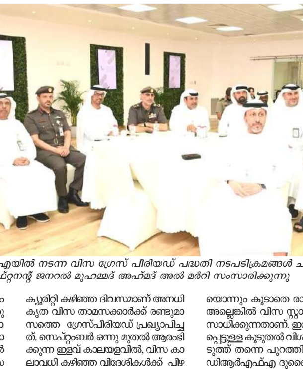
ദുബൈ ജിഡിആർഎഫ്എയിൽ നടന്ന വിനയം ലഭിച്ച താമസിക്കുന്നവർക്ക് പ്രത്യേക ടീം രൂപീകരിക്കുന്നതിന് വേണ്ടി ചേർന്ന യോഗത്തിൽ

ദുബൈ: യു.എ.ഇയിൽ വിനയം ലഭിച്ച താമസിക്കുന്നവർക്ക് പ്രത്യേക ടീം രൂപീകരിച്ചു