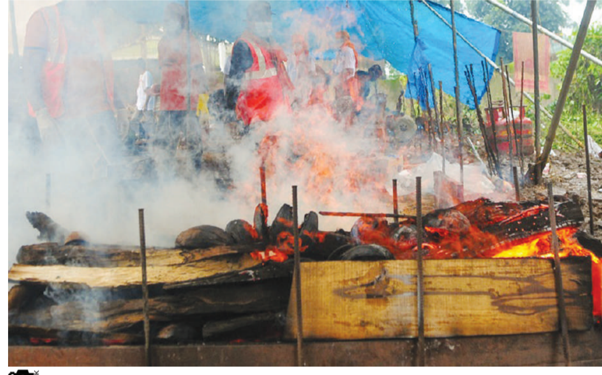
ചുരൽമലയിലെ ഉരുൾപൊട്ടലിൽ മരിച്ചയാളുടെ മൃതദേഹം മേപ്പാടി ശ്മശാനത്തിൽ ദഹിപ്പിക്കുന്നു.