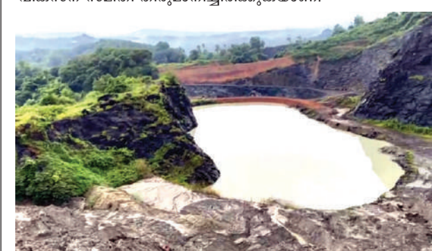
പൂല്ല്യഞ്ചേരി കരിങ്കൽ ക്യാറിയിൽ വെള്ളം നിറഞ്ഞ നിലയിൽ

മഞ്ചേരി: തലക്ക് മുക്കളിൽ ജലബോംബുമായി പൂല്ല്യഞ്ചേരിക്കാർ. പൂല്ല്യഞ്ചേരിയിലും പരിസരത്തും പ്രവർത്തിക്കുന്ന ക്യാറികൾ നാടിന്റെ ഭീഷണിയിൽ മാറുന്നു. ക്യാറികളിൽ വലിയ തോതിൽ വെള്ളം കെട്ടി നിൽക്കുന്നതാണ് വലിയ ദുരന്തത്തിലേക്ക് നയിക്കുന്ന മോശമായ ആരംഭം തുടങ്ങിയത്. നാട്ടുകാർ പ്രതിഷേധം ഉയർത്തിയിട്ടും വനം, പൊലീസ്, ജിയോളജി വകുപ്പുകൾ അനങ്ങിയിട്ടില്ല. നിരവധി ക്യാറികളുള്ള പൂല്ല്യഞ്ചേരി ദുരന്തമുഖത്താണ് ഉള്ളതെന്ന് നാട്ടുകാർ പറയുന്നു. പൂഴ്കാവ് പ്രദേശത്തിന്റെ ഉയർന്ന ഭാഗം ചെങ്കല്ല് ക്യാറികൾ കൊണ്ട് നിറഞ്ഞിരിക്കുകയാണ്. വളരെ ഉയരത്തിൽ കിടക്കുന്ന ക്യാറികളിൽ വെള്ളം നിറയുകയും ഈ വെള്ളം വലിയ പമ്പുസെറ്റുകൾ ഉപയോഗിച്ച് പമ്പ് ചെയ്ത് പുറത്തേക്ക് ഒഴുക്കുകയുമാണ് ചെയ്യുന്നത്. ഇതോടെ വെള്ളം ഒഴുകിപ്പോകുന്ന സ്ഥലങ്ങളിൽ മണ്ണിടിച്ചിലും ഉണ്ടാകുന്നുണ്ട്. ക്യാറികൾക്കു താഴെ താഴ്വരയിൽ 120ൽ അധികം വീടുകളുണ്ട്. 30 ഓളം കുട്ടികൾ പഠിക്കുന്ന അഗസ്റ്റ്വാടിയും നൂറിൽപരം കുട്ടികൾ പഠിക്കുന്ന മദ്രസയും ജുമുഅത്ത് പള്ളിയും ക്യാറിയുടെ താഴ്ന്ന ഭാഗത്താണ്. കൂടുതലായുള്ള പ്രദേശം മുഴുവൻ വെള്ളത്തിനടിയിലാകും. കടലുണ്ടിപ്പുഴയുടെ 200 മീറ്റർ സമീപത്ത് കിടക്കുന്ന ഈ മേഖല ദേശത്തിനടുത്ത് ഏതാണ്ട് ഒന്നര കിലോമീറ്റർ അടുത്താണ് പയ്യനാട് വില്ലേജ് ഓഫീസ് സ്ഥിതി ചെയ്യുന്നത്. പൂല്ല്യഞ്ചേരി ഗ്രാമീണ നായാണെന്ന് നാട്ടുകാർ പറഞ്ഞു. അതിന്റെയും താഴ്വരയിൽ നിരവധി വീടുകൾ ഉണ്ട്. പ്രദേശത്തെ ഏറ്റവും ഉയരത്തിൽ സ്ഥിതിചെയ്യുന്ന ഈ ക്യാറിക്ക് എന്തെങ്കിലും സംഭവിച്ചാൽ ഒരു പ്രദേശം തന്നെ നാശമുണ്ടാകും. വയനാട് ഉരൾപൊട്ടൽ ദുരന്തത്തെ തുടർന്ന് മഞ്ചേരി തഹസീൽദാറടക്കമുള്ള റവന്യൂ ഉദ്യോഗസ്ഥർക്കും പൊലീസിലും പരാതി നൽകുവാൻ പൂല്ല്യഞ്ചേരി ഗ്രാമ വികസന സമിതി തീരുമാനിച്ചിരിക്കുകയാണ്.