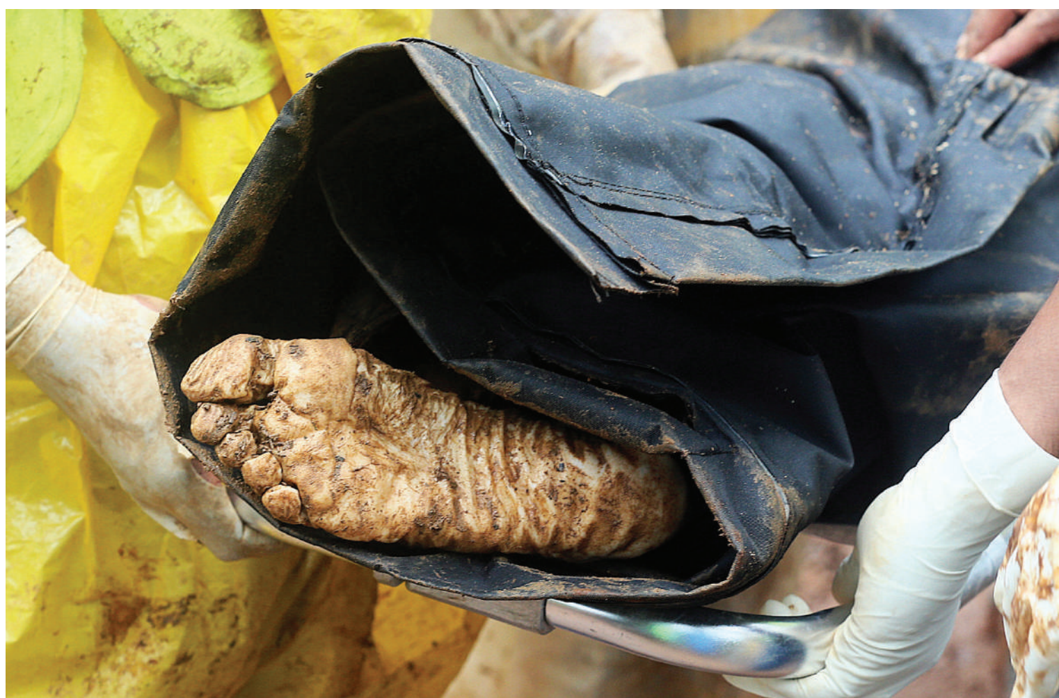
തണുത്തുറയാത്ത താങ്ങേ... ജാതിയില്ല, മതമില്ല, രാഷ്ട്രീയമില്ല... ഉള്ളത് മനുഷ്യത്വം മാത്രം. വയനാട് മുണ്ടകളിലെ ഉരുൾപൊട്ടൽ ദുരന്തമേഖലയിൽ നിന്ന് കണ്ടെടുത്ത മൃതദേഹങ്ങളിലൊന്ന് ആപ്ലിക്കേഷൻ സിലേക്ക് മാറ്റുന്ന രക്ഷാപ്രവർത്തകർ