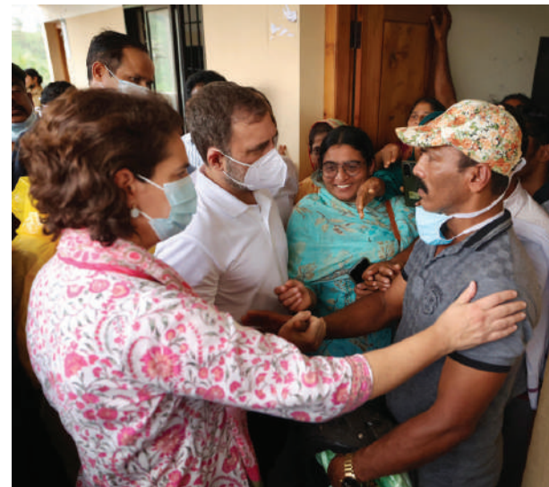
പ്രതിപക്ഷ നേതാവ് രാഹുൽ ഗാന്ധി, പ്രിയങ്ക ഗാന്ധി എന്നിവർ ദുരിതാശ്വാസ ക്യാമ്പുകളിലെ ദുരിതബാധിതരെ ആശ്വസിപ്പിക്കുന്നു