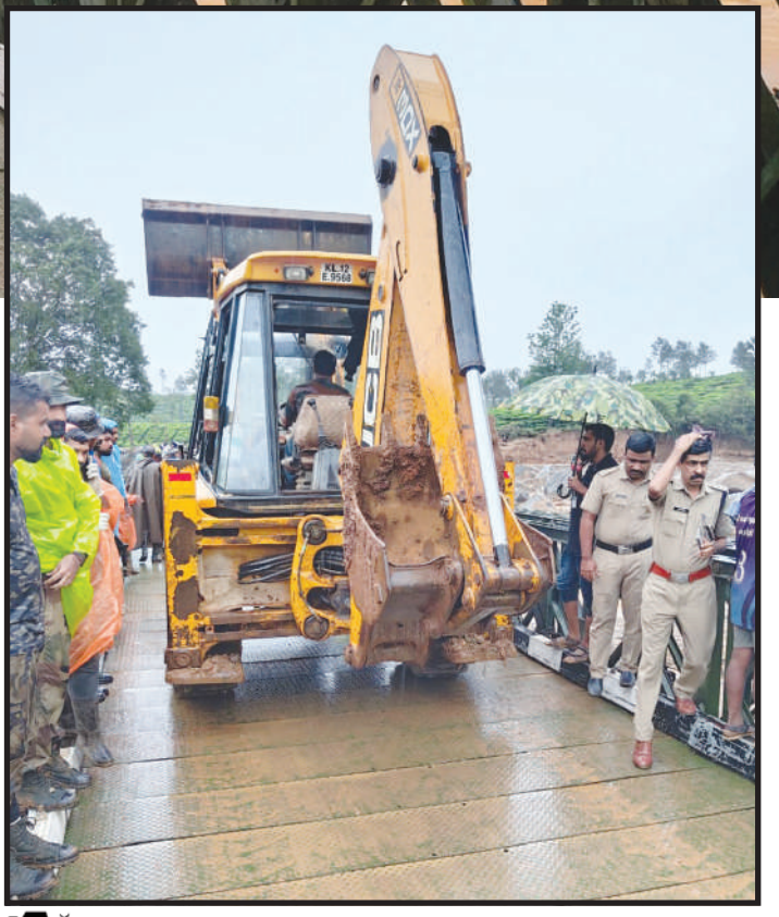
ബെരിലി പാലത്തിലൂടെ മണ്ണുമാന്തി യന്ത്രം കയറ്റിവടുന്ന്