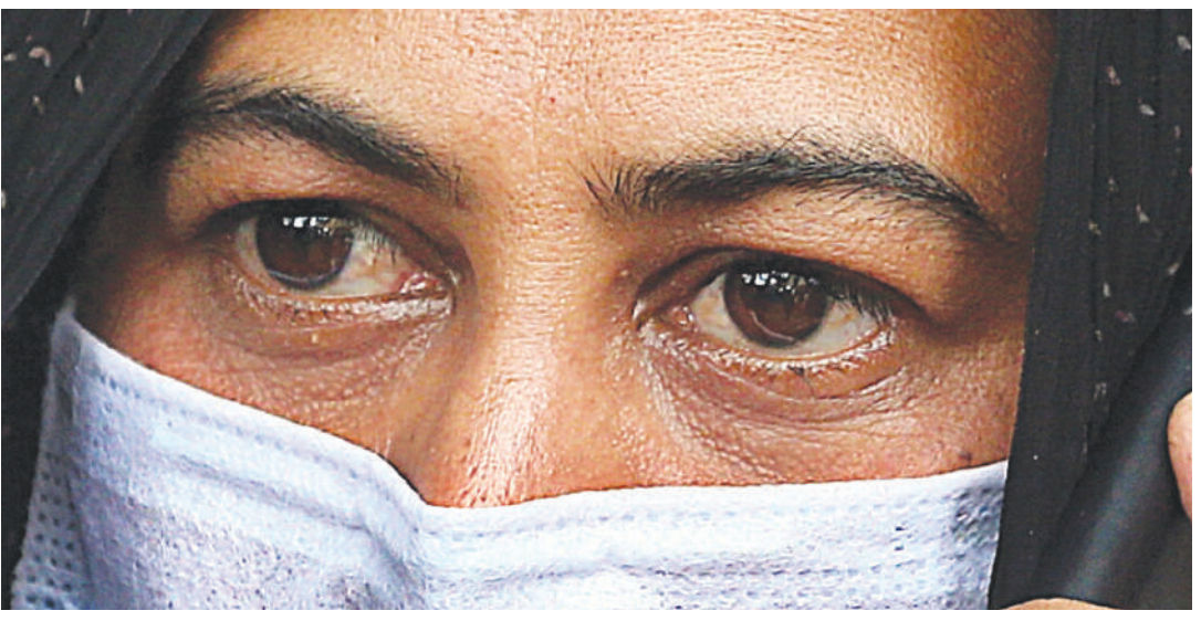
കണ്ണീർ വറ്റി... ഉരുൾപൊട്ടലിൽ ഉറ്റവർ നഷ്ടപ്പെട്ട നിരവധി പേരാണ് ഈ മണ്ണിൽ. ദുരന്തത്തിൽ തന്റെ കുടുംബത്തിലെ ഉപ്പുയും ഉമ്മയും മക്കളുമടക്കം പതിനൊന്നോളം പേർ നഷ്ടപ്പെട്ട വീട്ടമ്മ. മേപ്പാടി ഗവ. ഹയർ സെക്കണ്ടറി സ്കൂളിലെ ദുരിതാശ്വാസ ക്യാമ്പിൽ നിന്നുള്ള കാഴ്ച

മേപ്പാടി: നൂറുകണക്കിന് പേർക്ക് ജീവൻ നഷ്ടപ്പെടുകയും അതിലൂടെ മെത്രയോ അധികം പേർക്ക് സർവ്വവും ഇല്ലാതാവുകയും ചെയ്ത മുണ്ടക്കൈ ഉരുൾപൊട്ടൽ പ്രദേശത്തെ നന്മഹൃദയങ്ങളുടെ കൂട്ടായ്മ പ്രതിസന്ധികളെ അതിജീവിക്കാൻ കരുത്തുപകരുമെന്ന് മുസ്ലിംലീഗ് ദേശീയ ഓർഗനൈസിംഗ് സെക്രട്ടറി ഇ.ടി മുഹമ്മദ് ബഷീർ എം.പി പറഞ്ഞു. ലോകസഭാ പ്രതിപക്ഷ നേതാവ് രാഹുൽ ഗാന്ധിക്കും എ.ഐ.സി.സി സെക്രട്ടറി പ്രിയങ്ക ഗാന്ധിക്കും മേപ്പാടിയിലെ വിവിധ ദുരിതാശ്വാസ ക്യാമ്പുകളിൽ അദ്ദേഹം സന്ദർശനം നടത്തി. എല്ലാം നഷ്ടപ്പെട്ടവരാണ് വിവിധ ക്യാമ്പുകളിലായി കഴിയുന്നത്. അവർക്കായി ഭരണകൂടവും സന്നദ്ധ പ്രവർത്തകരും സ്മൃതപുരഹമായ സേവനങ്ങളാണ് ചെയ്തുപോരുന്നത്. ഇത് നല്ല മാതൃകയാണ്. അപകടത്തിൽ പെട്ടവർക്കും അഭയകേന്ദ്രത്തിലെത്തിയവർക്കും ആവശ്യമായതെല്ലാം ഉറപ്പ് വരുത്തേണ്ടതുണ്ട്. നൂറുകണക്കിന് മനുഷ്യരാണ് സഭാ സേവനസജ്ജരായി കാമ്പുകൾക്കൊപ്പമുള്ളത്. ഇത് ദുരിതബാധിതരുടെ പുനരധിവാസത്തിലും തുടരണം. കാമ്പിൽ നിന്നിറങ്ങിയവരും ഇവർക്ക് കിടപ്പുടം ഇല്ലാതാവരുത്. സ്വന്തം വീടുകളിലേക്ക് മടങ്ങുന്നത് വരെ ഇവരുടെ കാര്യങ്ങൾക്ക് സർക്കാർ ഒപ്പമുണ്ടാവണമെന്നും അദ്ദേഹം ആവശ്യപ്പെട്ടു. ഡൽഹിയിൽ നിന്നാണ് ഇ.ടി മുഹമ്മദ് ബഷീർ എം.പി വയനാട്ടിലെത്തിയത്.