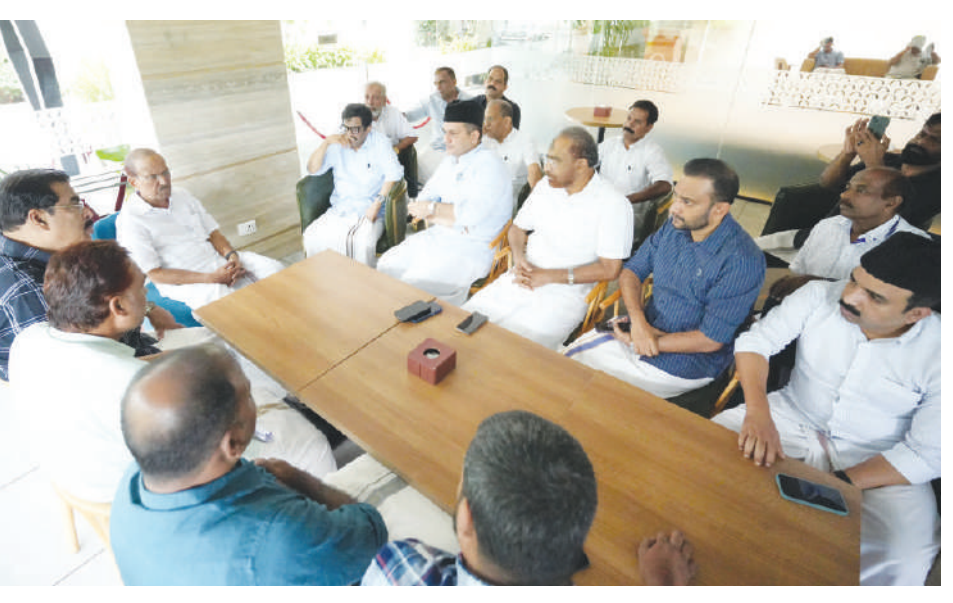
ദുരിതാശ്വാസ പ്രവർത്തനങ്ങൾ ഏകോപിപ്പിക്കുന്നതിന്റെ ഭാഗമായി മുസ്ലിംലീഗ് ദേശീയ ജനറൽ സെക്രട്ടറി പി.കെ. കുഞ്ഞാലിക്കുട്ടി കൽപ്പറ്റയിൽ വിളിച്ചുചേർത്ത മുസ്ലിംലീഗ് നേതാക്കളുടെ പ്രത്യേക അവലോകന യോഗം

കൽപ്പറ്റ: വയനാട്ടിലെ ഉരുൾപൊട്ടൽ ദേശീയ ദുരന്തമായി പ്രഖ്യാപിക്കണമെന്ന് മുസ്ലിംലീഗ് ദേശീയ ജനറൽ സെക്രട്ടറി പി.കെ. കുഞ്ഞാലിക്കുട്ടി വിളിച്ചു. ചേർത്ത മുസ്ലിംലീഗ് നേതാക്കളുടെ പ്രത്യേക അവലോകന യോഗം സർക്കാരിനോട് ആവശ്യപ്പെട്ടു. ഇപ്പോൾ രക്ഷാ പ്രവർത്തനത്തിന് മുൻഗണന നൽകണം. കാണാതായ മുഴുവൻ മൃതദേഹങ്ങളും കണ്ടെത്തണം. പുഴയിലൂടെ സഞ്ചരിച്ച കിലോമീറ്ററുകൾ ഒഴുകിയ ശേഷമാണ് നിരവധി മൃതദേഹങ്ങൾ ലഭിച്ചത്. പുഴയുടെ കൈവഴികളിൽ തങ്ങാൻ സാധ്യതയുള്ള മൃതദേഹങ്ങൾ കണ്ടെത്തണം.