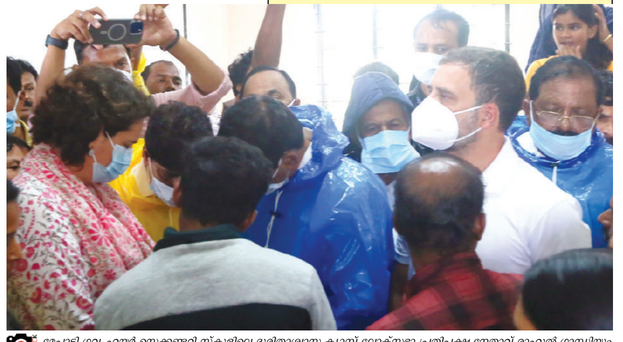
മേപ്പാടി ഗവ. ഹയർ സെക്കണ്ടറി സ്കൂളിലെ ദുരിതാശ്വാസ ക്യാമ്പ് ലോകസഭാ പ്രതിപക്ഷ നേതാവ് രാഹുൽ ഗാന്ധിയും എ.ഐ.സി.സി ജനറൽ സെക്രട്ടറി പ്രിയങ്ക ഗാന്ധിയും മുസ്ലിംലീഗ് ദേശീയ ഓർഗനൈസിംഗ് സെക്രട്ടറി ഇ.ടി മുഹമ്മദ് ബഷീർ എം.പിയും സന്ദർശിച്ചപ്പോൾ