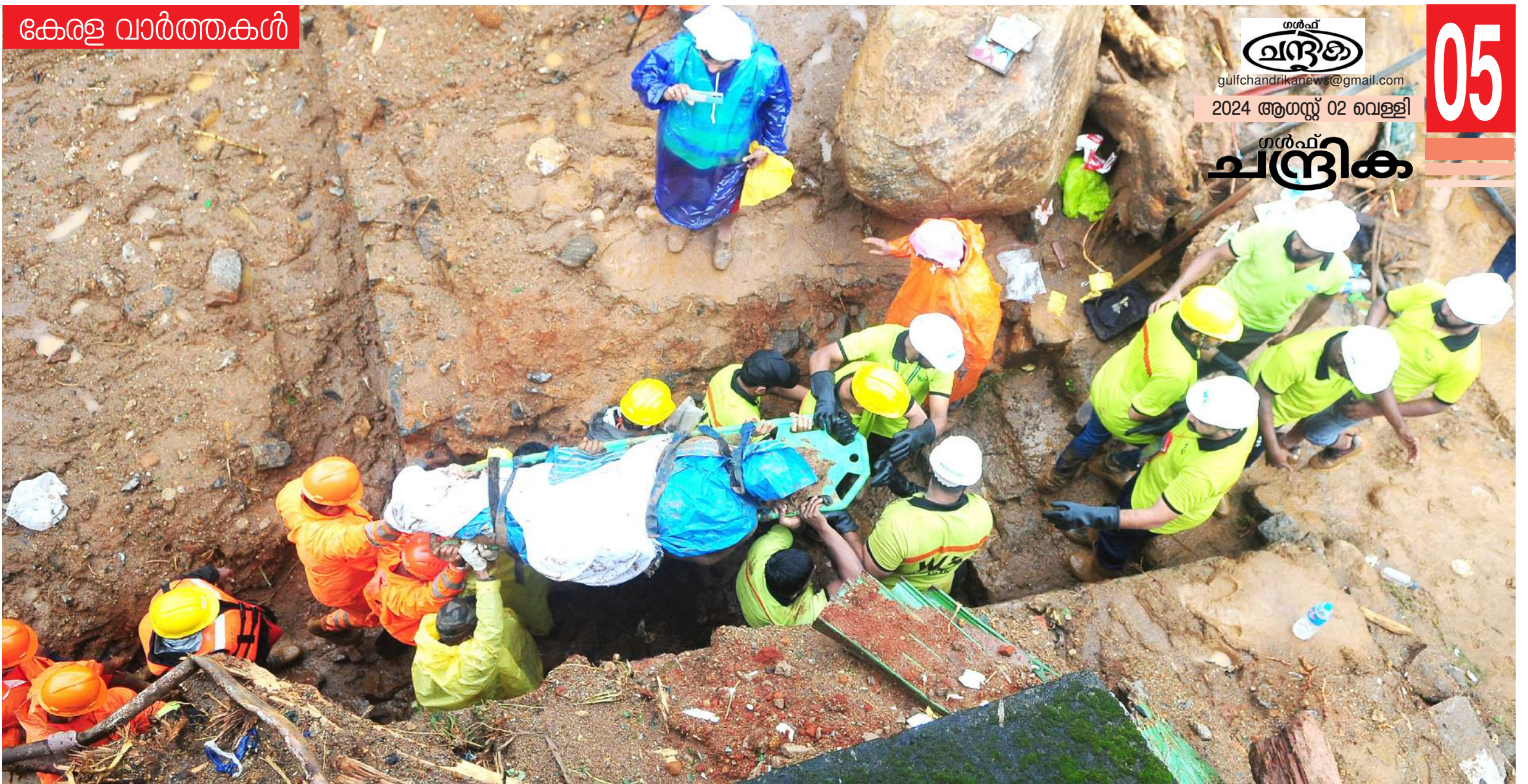
ഉരുൾപൊട്ടൽ ദുരന്തമുണ്ടായ സ്ഥലത്തുനിന്നും രക്ഷാപ്രവർത്തകർ മരിച്ചവരുടെ മൃതദേഹം പുറത്തെത്തിക്കുന്നു.