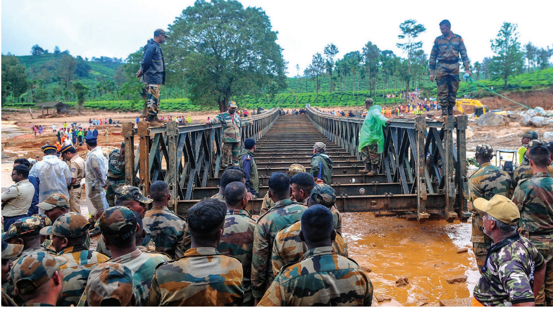
ഇന്ത്യൻ ആർമിയുടെ മദ്രാസ് എഞ്ചിനീയറിംഗ് ഗ്രൂപ്പ് അതിവേഗം നിർമ്മിച്ച ബെയ്ലി പാലം