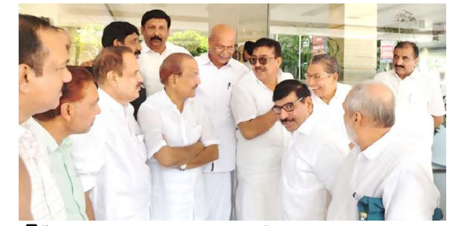
മുഖ്യമന്ത്രി വിളിച്ച സർവകക്ഷി യോഗത്തിന് മുന്നോടി യായി കൽപ്പറ്റയിലെത്തിയ മുസ്ലീംലീഗ് നേതാക്കൾ

കോഴിക്കോട്: ചുരൽമലയിലും മുണ്ടക്കൈയിലും മനുഷ്യജീവനുകൾ രക്ഷക്കായി തേടിയപ്പോൾ ചടവല സേവനങ്ങളുമായി അണിനിരന്ന യൂത്ത്ലീഗ് വൈറ്റ് ഗാർഡ് അംഗങ്ങൾ. ദുരന്തത്തിനുമുന്നിൽ പങ്കാളിത്തംകൊണ്ട് അതിലകപ്പെട്ടവരുടെ കണ്ണിരൊപ്പാൻ ശ്രമിച്ചുവരുന്ന അണിനിരന്ന യൂത്ത്ലീഗിന്റെ നൂറുകണക്കിന് അംഗങ്ങളാണ്. ചുരൽമലക്കു മുമ്പെ പുത്തുമലയിലും കവളപ്പുറയിലുമൊക്കെ ഏറെ പ്രശംസ പിടിച്ചുപറ്റിയതാണ് വൈറ്റ് ഗാർഡിന്റെ സേവനപ്രവർത്തനങ്ങൾ.പരിഷ്കരിച്ച ക്യാമ്പുകളിൽ കഴിയുന്നവർക്ക് അവസരദോഷമില്ലാതെ സഹായങ്ങളെത്തിക്കാൻ വൈദ്യുതിയോ മറ്റു സാഹായങ്ങളോ ഇല്ലാതെ ഇരുട്ടിലും സേവനത്തിനായി വൈറ്റ്ഗാർഡ് അംഗങ്ങൾ. മലപ്പുറം ജില്ലയിൽനിന്നും പതിനാറ് അംഗങ്ങളടങ്ങുന്ന സംഘമാണ് ആദ്യം പുറപ്പെട്ടത്. പോത്തുകളിൽ എത്തിയ സംഘം രക്ഷാപ്രവർത്തനങ്ങളിൽ വ്യാപൃതരായെങ്കിലും ചുരൽമലയിലെ സാഹചര്യം പരിഗണിച്ച് നാട്ടുകാണി വഴി ആ ഭാഗത്തേക്കു പോയി. ആദ്യ ദിവസം പ്രധാനമായും മരിച്ച കിടക്കുന്നവരുടെ ശരീരങ്ങൾ കണ്ടെത്തലും അവശിഷ്ടങ്ങൾ സൂക്ഷ്മമായി പരിശോധനയ്ക്കുമാണ് മുൻഗണനയുള്ളത്. കോഴിക്കോട് നിന്നും കണ്ണൂർ നിന്നും ഉണ്ടായ അംഗങ്ങൾ എത്തിയതോടെ എല്ലാ ഭാഗങ്ങളിലും വൈറ്റ് ഗാർഡ് അംഗങ്ങളുടെ പ്രവർത്തനങ്ങൾ സജീവമായി. വയനാടിലെ നിരവധി അംഗങ്ങളും പങ്കുചേർന്നു. ദുരന്തത്തിന്റെ രണ്ടാം ദിവസമാണ് വൈറ്റ് ഗാർഡ് സംഘം ചുരൽമലയിലെത്തി മരണമുറ്റി ചുരത്തുപുറം കോൺക്രീറ്റുകൾക്കും മറ്റും അകത്ത് കിടക്കുന്ന മൃതദേഹങ്ങളും കണ്ടെത്താൻ രംഗത്തിറങ്ങിയത്. കനത്ത മഴയും തണുപ്പും പലപ്പോഴും പ്രതിബന്ധ