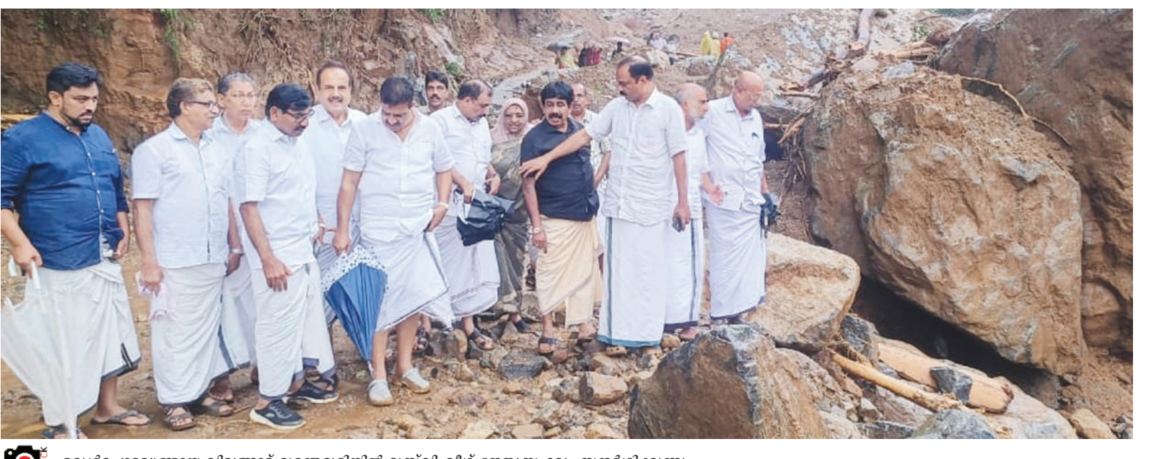
ഉരുൾപൊട്ടലുണ്ടായ വിലങ്ങാട് ദുരന്തമുഖിയിൽ മുസ്ലിംലീഗ് നേതൃസംഘം സന്ദർശിക്കുന്നു