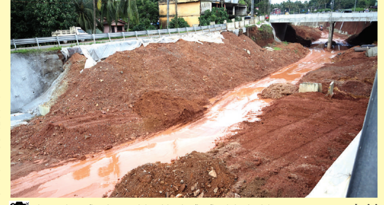
തിരുവങ്ങാടി കക്കാട് ദേശീയ പാതയിൽ മണ്ണിടിച്ചെടുത്ത് മണ്ണ് കൂട്ടിയിട്ടു നിലയിൽ

നിയം പന്താടുന്നത്. സർവീസ് റോഡിനോട് ചേർന്ന് മണ്ണ് തുരന്നുണ്ടാക്കിയ മതിലിൽ കമ്പി തുളച്ചു സിമന്റ് പ്ലാസ്റ്റർ ചെയ്യുന്നതാണ് വിടയുടെ രീതി. ഇത് സ്ഥാപിച്ചു സ്ഥലത്താണ് കക്കാട് മണ്ണ് ഇടിച്ചെടുത്തത്. കനത്ത മഴയിൽ ഇതരയും ഉയരത്തിൽ താങ്ങിനിൽക്കാൻ കഴിയാതിരുന്നതാണ് ആവർത്തിച്ചുള്ള തകർച്ച വ്യക്തമാക്കുന്നത്. കനത്ത മഴയിൽ മലവെള്ളപ്പാച്ചിൽ കണക്കെയാണ് വെള്ളം ഒഴുകുന്നത്. തുരന്നുണ്ടാക്കിയ മതിലിനോട് ചേർന്ന് ഉറപ്പുള്ള കോൺക്രീറ്റ് മതിൽ നിർമ്മിക്കേണ്ടതിനു പകരമാണ് പുതിയ സാങ്കേതികവിദ്യയെന്ന് പറഞ്ഞ് സിമന്റ് സപ്ലൈ ചെയ്ത് ഉറപ്പാക്കാൻ ശ്രമിക്കുന്നത്. ഇത് പരമാർത്ഥമാണെന്ന് തകർച്ച തെളിയിക്കുന്നത്. വൻ ദുരന്തത്തിനാണ് കക്കാട് പ്രദേശം കാതോർക്കുന്നത്. സുരക്ഷയുണ്ടെന്ന് കരുതിയാണ് വാഹനങ്ങൾ സർവീസ് റോഡിലൂടെ ഓടുന്നത്. റോഡ് തകർന്ന് വാഹനങ്ങൾ മറിഞ്ഞാൽ ഏറെ ആഴത്തിലായിരിക്കും പതിക്കുക. രണ്ട് തവണയുണ്ടോ