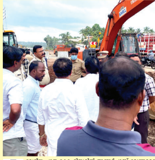
ദേശീയ പാത കോഹിനൂർ അണ്ടർപാസ് വേണമെന്ന ആവശ്യം മുഖവിലക്കെടുക്കാതെ പ്രവൃത്തിയുമായി മുന്നോട്ട് പോവുന്നത് സമരസമിതിയുടെ നേതാക്കൾ തടയുന്നു