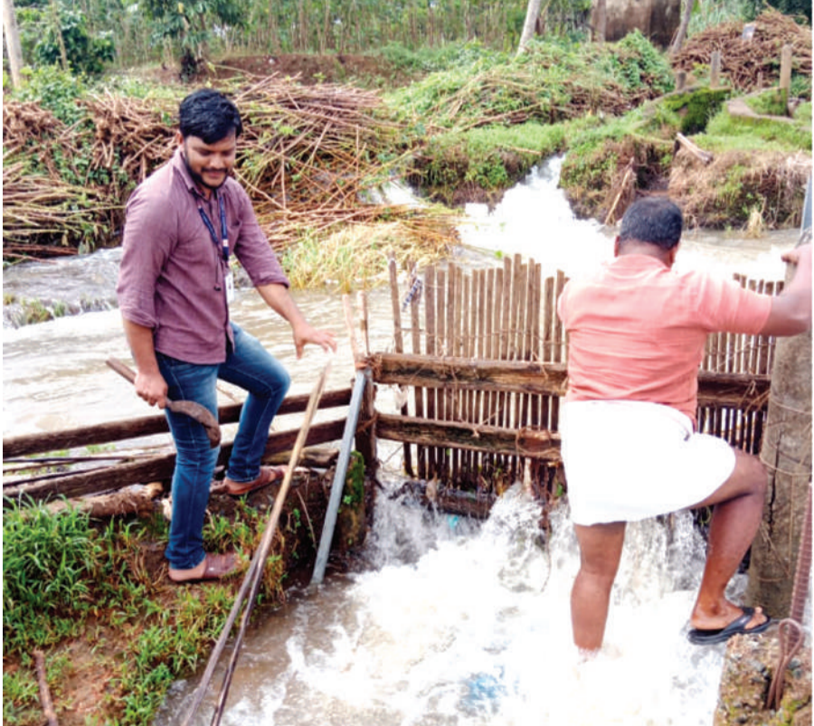
കുറുവ മുത്തൂർകുണ്ടിന് സമീപം ചെറുപുഴയിൽ അന്ധകൃത മത്സ്യബന്ധനത്തിനായി നിർമ്മിച്ച തടയണകൾ ഫിഷറീസ് വകുപ്പ് ഉദ്യോഗസ്ഥർ നീക്കം ചെയ്യുന്നു

നെ നിപ സ്രവ പരിശോധനയ്ക്കായി നാഷണൽ ഇൻസ്റ്റിറ്റ്യൂട്ട് ഓഫ് വൈറോളജിയുടെ മൊബൈൽ ലാബോട്ടറി പ്രവർത്തനം തുടങ്ങി. ഇങ്ങനെ പഴുതടച്ച പ്രതിരോധ പ്രവർത്തനങ്ങളാണ് കഴിഞ്ഞ ഒരാഴ്ച പ്രതിരോധ പ്രവർത്തനങ്ങളിൽ കണ്ടത്. ആ പ്രവർത്തനങ്ങളുടെ ഫലമായി 14കാണെന്ന് മണ്ണിടിച്ചെടുത്തതിന്റെ വേദനകൾക്കിടയിലും ആശ്വാസത്തിന്റെ പരിശോധനാഫലങ്ങളെത്തുന്നതും ആശ്വാസം വരുമ്പോഴും ജാഗ്രത വേണമെന്നാണ് ആരോഗ്യവകുപ്പ് പറയുന്നത്.