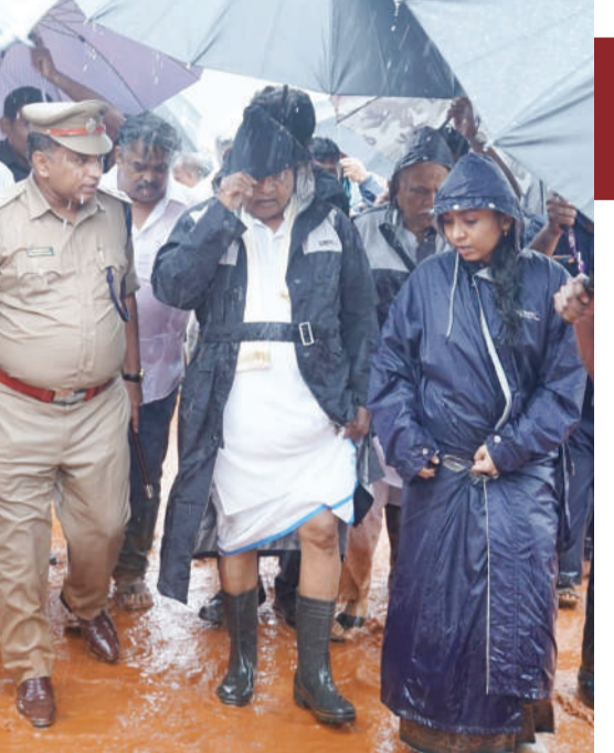
കേരളത്തിലെ ഏറ്റവും കൂടുതൽ പട്ടണങ്ങളുള്ള തിരച്ചിൽ ഗംഗാവലി പുഴയിലേക്ക് തിരച്ചിൽ പുറപ്പെടുവിച്ചു. ഇത് ബൈഡൻ്റെ നിയമനിയമങ്ങൾക്ക് വിരുദ്ധമാണ്.

ലിയാലൂർ റോഡ് പുഴയിലേക്കാണ് തിരച്ചിൽ പുറപ്പെടുവിച്ചത്. ഇത് ബൈഡൻ്റെ നിയമനിയമങ്ങൾക്ക് വിരുദ്ധമാണ്. തിരുത്തലുകളുടെ ഭാഗമായി ഡയറക്ടർമാർക്ക് തിരുത്തൽ വരുത്താൻ ഉത്തരവ് പുറപ്പെടുവിച്ചു. ഇത് ബൈഡൻ്റെ നിയമനിയമങ്ങൾക്ക് വിരുദ്ധമാണ്.