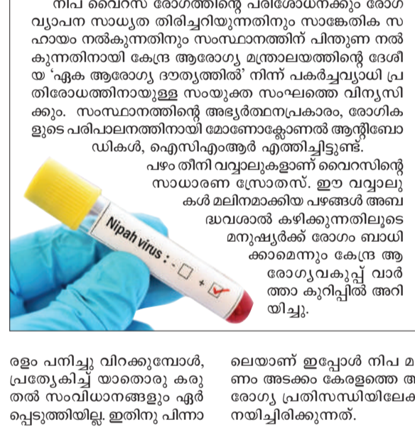
ഐ.സി.എം.ആർ സംഘം കോഴിക്കോട്ടെത്തി

കോഴിക്കോട്: നിലവോടെ ബാധിച്ച് ചികിത്സയിലിരിക്കെ ഇന്നലെ രാവിലെ 11.30 നാണ് മരണപ്പെട്ടത്. ഫുട്ബോളായിരുന്നു അഷ്മിൾ രാസനിഷ്പാദനങ്ങളായി. നിലവോടെ ബാധിച്ച് ചികിത്സയിലിരിക്കെ ഇന്നലെ രാവിലെ 11.30 നാണ് മരണപ്പെട്ടത്. ഫുട്ബോളായിരുന്നു അഷ്മിൾ രാസനിഷ്പാദനങ്ങളായി. നിലവോടെ ബാധിച്ച് ചികിത്സയിലിരിക്കെ ഇന്നലെ രാവിലെ 11.30 നാണ് മരണപ്പെട്ടത്.