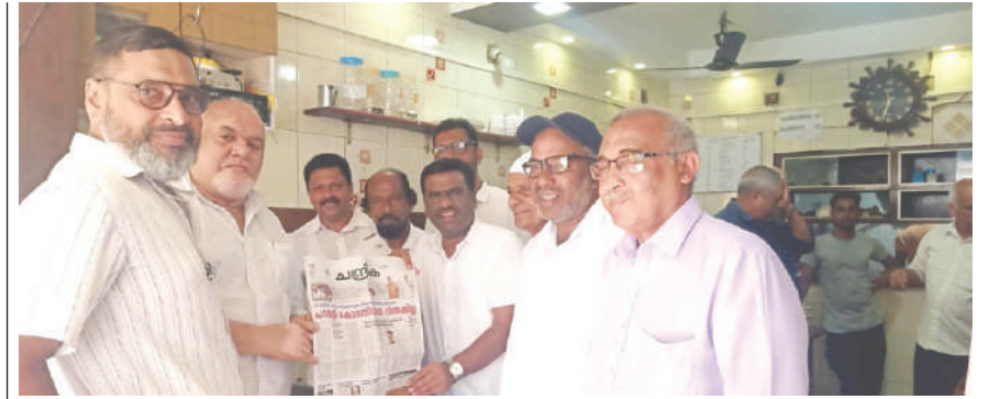
ചന്ദ്രികസിറ്റി ഡെവലപ്മെന്റ് ഓഫീസർമാർ ഹാജിമാർക്ക് സൗജന്യമായി തിരിച്ചെത്തിയപ്പോൾ

20 ഹാജിമാരുടെയും വിമാനത്താവളത്തിൽ സേവനത്തിനുള്ളായിരുന്നു. എമിഗ്രേഷൻ ഓഫീസർമാർ ഹാജിമാരുടെയും വിമാനത്താവളത്തിൽ സേവനത്തിനുള്ളായിരുന്നു.