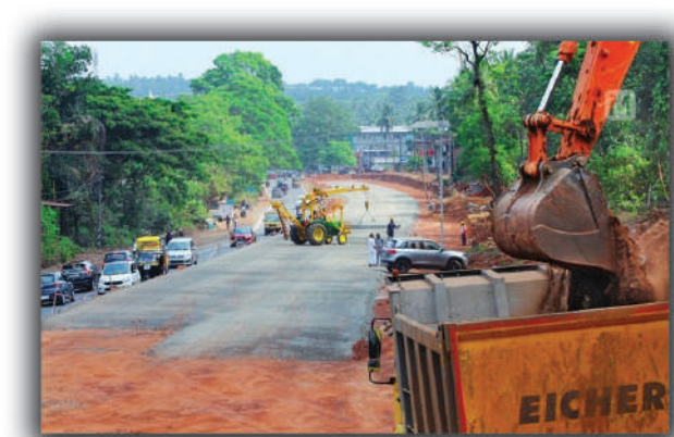
കുരുമുളക് വിൽപനയ്ക്ക് സൗകര്യം ഉണ്ടാക്കാനും രാമനളി, അഴീക്കോട് വില്ലേജിൽ നിന്ന് 20.79 ഹെക്ടർ ഭൂമി ഏറ്റെടുക്കാനും പൂർത്തിയായി.

കണ്ണൂർ: തീരദേശ ഹൈവേ നിർമ്മാണത്തിനായി ഭൂമി ഏറ്റെടുക്കാനുള്ള നടപടി വിലേജിൽ തുടങ്ങി. ഇതിന്റെ ഭാഗമായി രണ്ട് വിലേജിൽ 42 വീടുകൾ നഷ്ടമാകും.