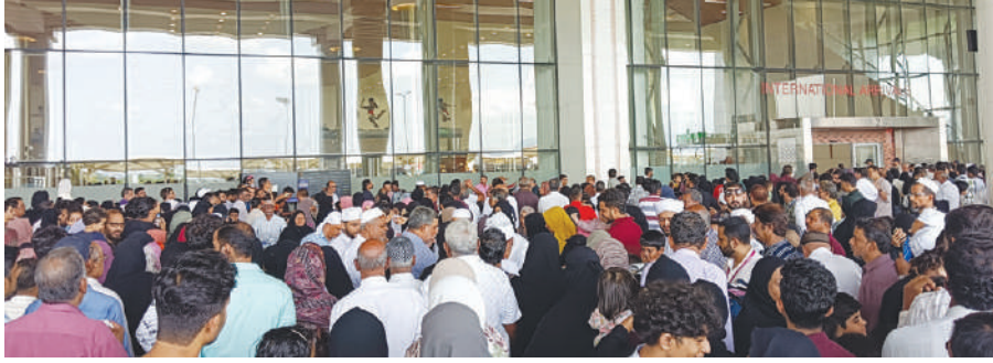
കണ്ണൂരിൽ നിന്നു പോയ ഹാജി തീർത്ഥാടകരിൽ ആദ്യ സംഘം വിമാനത്താവളത്തിലെത്തിയപ്പോൾ

മട്ടന്നൂർ: കണ്ണൂർ എംബർക്കേഷൻ പോയിന്റ് വഴി ഇറവർഷം ഹാജിമാർക്ക് പോയ തീർത്ഥാടകരിൽ ആദ്യസംഘം വീടേക്കു തിരിച്ചെത്തി. ഇപ്പോൾ 12മാസം 346 ഹാജിമാർക്ക് സൗജന്യമായി തിരിച്ചെത്തിയിട്ടുണ്ട്. ഇതിൽ 5140 വിമാനത്തിൽ എത്തിയത്, വിദേശ കർമ്മത്തിന്റെ ധന്യതയ്ക്ക് നന്ദാർപ്പിച്ച് തിരിച്ചെത്തിയ 15 വിമാനത്തിൽ നിന്നും 346 ഹാജിമാർക്ക് സൗജന്യമായി തിരിച്ചെത്തിയിട്ടുണ്ട്. ഇതിൽ 5140 വിമാനത്തിൽ എത്തിയത്, വിദേശ കർമ്മത്തിന്റെ ധന്യതയ്ക്ക് നന്ദാർപ്പിച്ച് തിരിച്ചെത്തിയ 15 വിമാനത്തിൽ നിന്നും 346 ഹാജിമാർക്ക് സൗജന്യമായി തിരിച്ചെത്തിയിട്ടുണ്ട്.