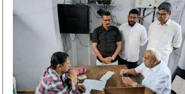
മുസ്ലിം ലീഗ് നേതാക്കൾ നിവേദനം നൽകുന്നു