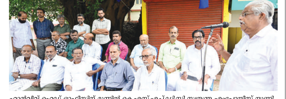
ഹാൻവിവ് ഹെഡ് ഓഫീസിൽ എസ്.ടി.യു പ്രതിഷേധം

പാലയാട് പബ്ലിക് വെൽഫെയർ കോ-ഓപ്പറേറ്റീവ് സൊസൈറ്റിക്ക് ഒന്നാം സ്ഥാനം. ഇതിന്റെ ഭാഗമായി തലശ്ശേരി മുസ്ലിം ലീഗ് നേതാക്കൾ നിവേദനം നൽകി.