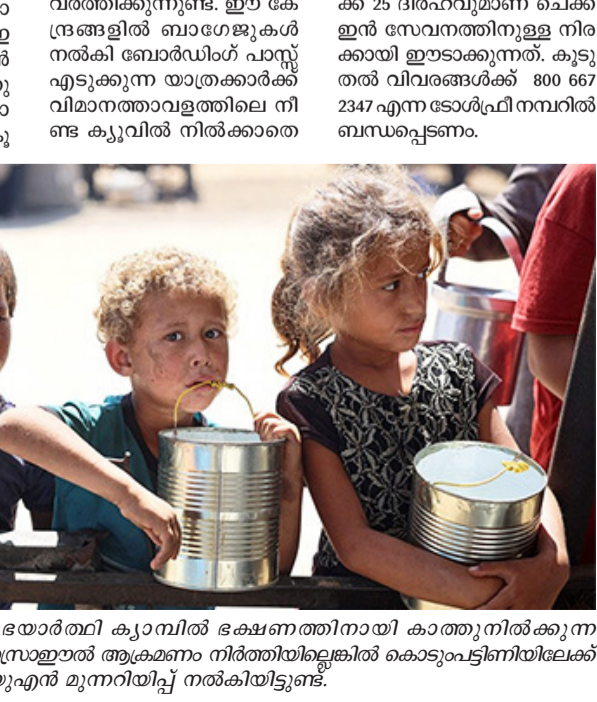
ഗസ്സിലെ അഭയാർത്ഥി ക്യാമ്പിൽ ഭക്ഷണത്തിനായി കാത്തുനിൽക്കുന്ന കുര്യന്മാർ. ഇസ്രായേൽ ആക്രമണം നിർത്തിയെടുക്കാൻ കൊടുവട്ടിണിയ്ക്കപ്പെട്ടവർക്ക് യുഎഇ മുന്നറിയിപ്പ് നൽകിയിട്ടുണ്ട്.